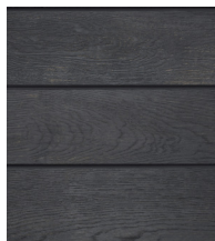
Antracyt - MCG360R