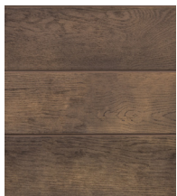
Ciemny dąb - MCG360A