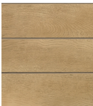
Złoty dąb - MCG360G