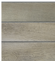
Dąb dymiony - MCG360D